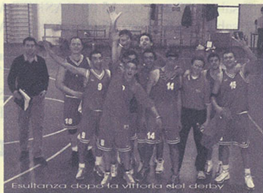
Esultanza dopo la vittoria del derby